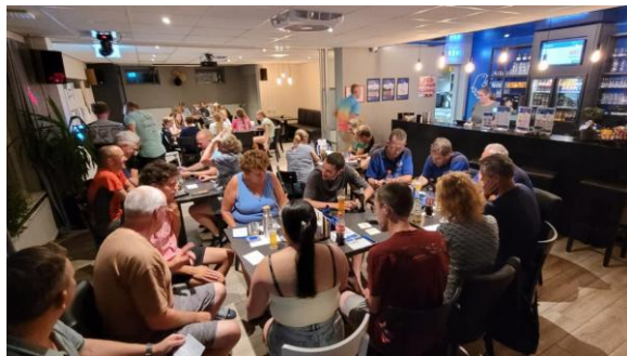
Muziekingo tijdens de Ben Saris Meerkampen