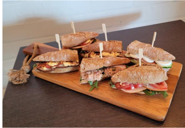
Broodjesassortiment bij een activiteit