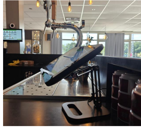
Nieuwe schermen voor het kassasysteem