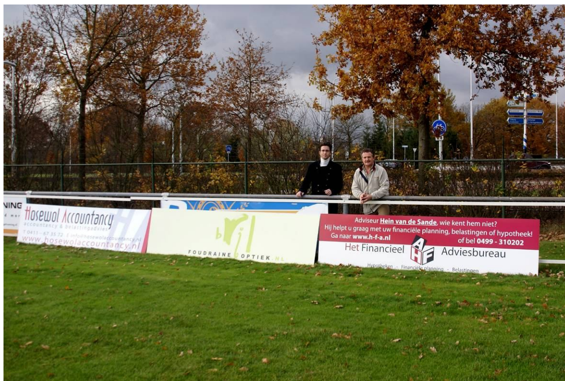
de 1e drie borden zijn geleverd door RKdisgn. (Ronny Krijger)